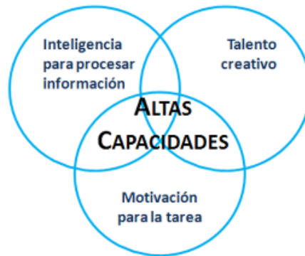
Figura 1: "Los tres anillos de la alta capacidad" (Renzulli, J. 1977)

Cuando hablamos de superdotado nos referimos a un individuo con inteligencia igual o superior a 130. Para Renzulli, J. (1977): lo que define a un individuo superdotado es la posesión de tres conjuntos básicos de características estrechamente relacionadas y con un igual énfasis en cada una de ellas (las cuales se muestran en la figura 1.)